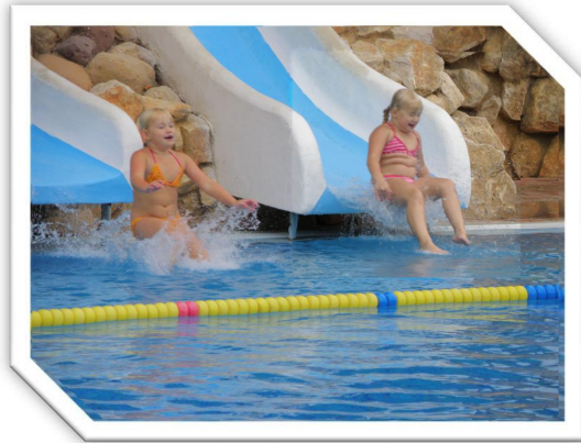
Uimakelit olivat parhaimmillaan syys- lokakuussa.

Aluksi viikko lepäiltiin ja annettiin lasten (ihan vähän itsekin) nauttia uima-altaiden tuomasta hyvän mielen tuntemuksista. Sitten lähdettiin etsimään ”turistimatkoitoimistoa” joka järjestää matkoja ja vuokra-autoja paikallisille. Oli tiistai 22. syyskuuta iltapäivä ja Espanjassa on kaikki