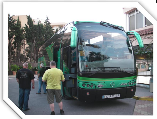
Kuljetuskalusto oli parasta A-luokkaa niin kuin kuljetettavatkin.