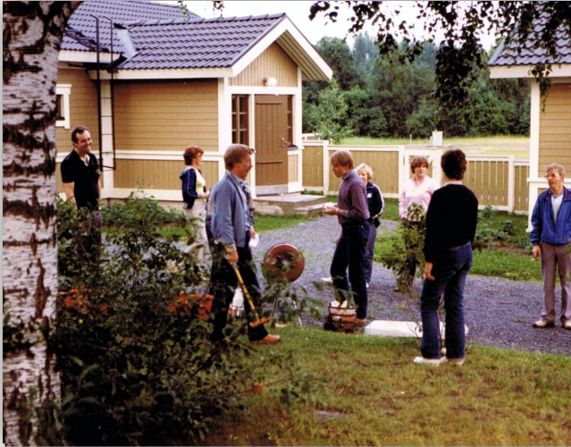
JSAST:n Kesäretki -84, Mikkeli Visulahti.

Autosuunnistajien tekemät kesäretket periytyvät pitkältä 1960-luvun tiimoilta. Itse olen